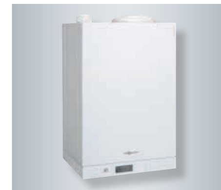
Котел Vitodens 111-W со встроенным 46-литровым емкостным накопителем