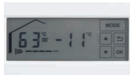
Жидкокристаллический сенсорный дисплей с подсветкой

Настенные газовые конденсационные котлы Vitodens 100-W и Vitodens 111-W управляются при помощи новой жидкокристаллической сенсорной панели управления с подсветкой. Даже в темном помещении легко считывать информацию с дисплея и комфортно пользоваться панелью управления.